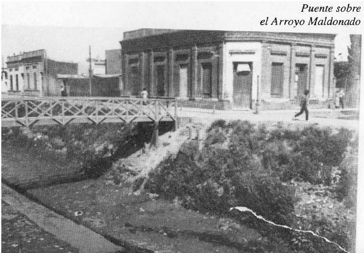
Puente sobre el Arroyo Maldonado

La jornada termina con una caminata y escucha colectiva del Arroyo Maldonado, que fluye entubado a pocas cuadras del club. Para esto tendremos micrófonos de contacto que jugaremos a colocar en diferentes lugares.